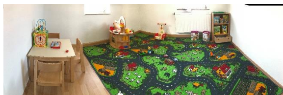
Panoramaaufnahme des Krippenzimmers

Nun ist es möglich, z. B. als Familie an einem Vortrag teilzunehmen, während die Kinder im Obergeschoss spielen.